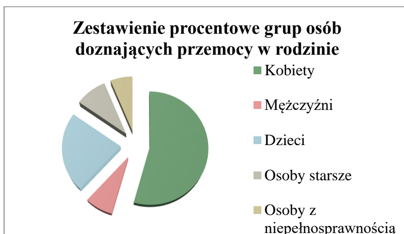
Wykres 1 Grupy osób doznające przemocy

Źródło: opracowanie własne na podstawie danych z ośrodków pomocy społecznej