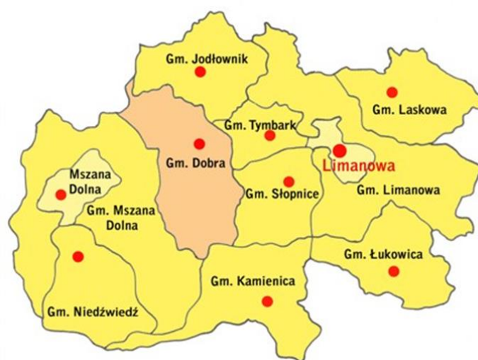
Rysunek 1 Mapa Powiatu Limanowskiego